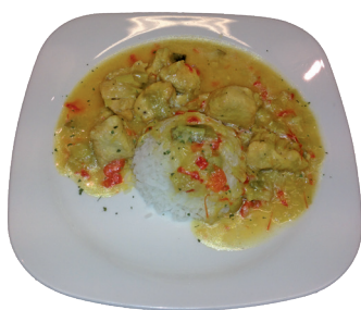
POLLO ALLA MYTHOS