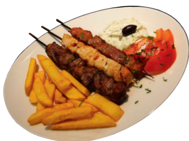
SPECIAL TRIS SUVLAKI (pollo, agnello, suino)