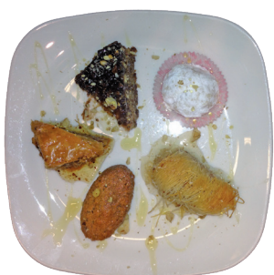
MISTO DI DOLCI