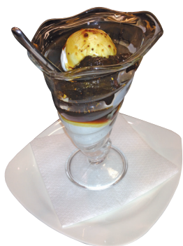
YOGURT CON FICHI