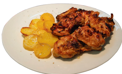
POLLO ALLA GRIGLIA