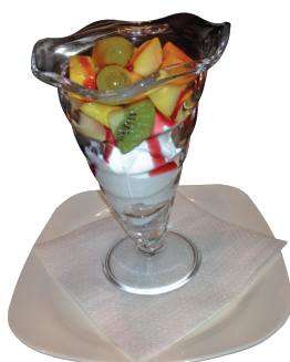
YOGURT ALLA FRUTTA