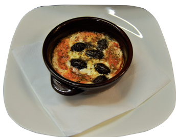
FETA AL FORNO