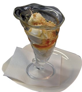
YOGURT MIELE E NOCI