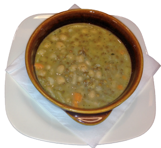
ZUPPA DI LEGUMI