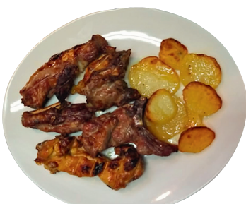
KOSTINE DI SUINO